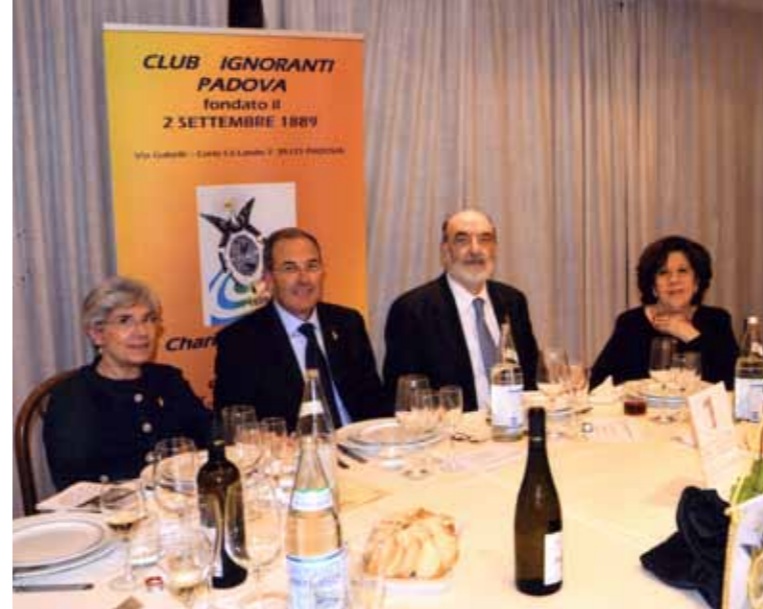
Il tavolo dei due Presidenti