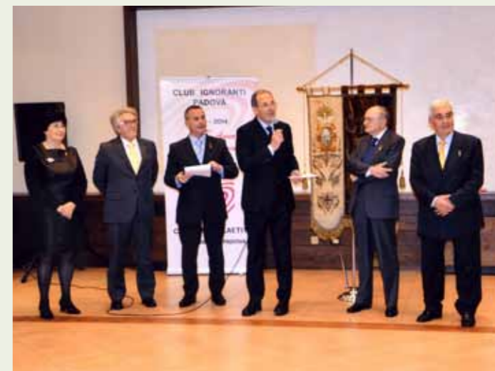
Pobiviri e Revisori dei conti