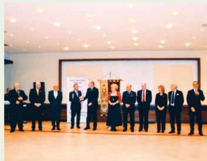
Il nuovo Consiglio Direttivo