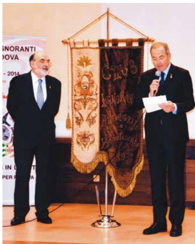
I due Presidenti