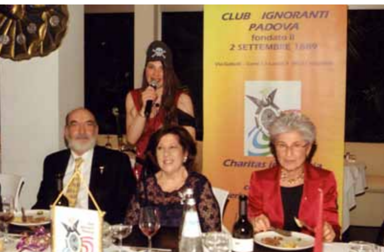
Il tavolo della Presidenza