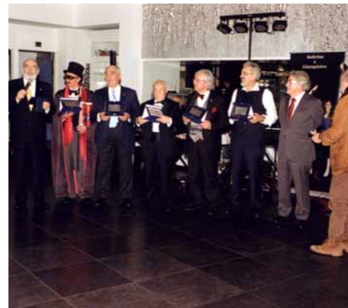
Soci-attori delle pieces teatrali del 125mo anniversario