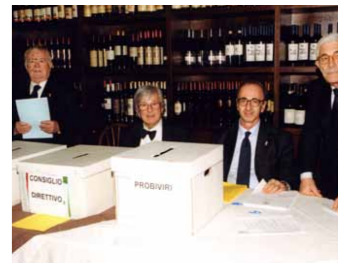
La commissione elettorale

Dopo queste parole, con un velo di sincera malinconia, vogliamo salutarla, caro Presidente, ringraziandola per l'impegno di tutti questi anni, mantenuto con signorilità e fermezza, tenendo alto il prestigio del Club, rendendoci orgogliosi della nostra appartenenza.