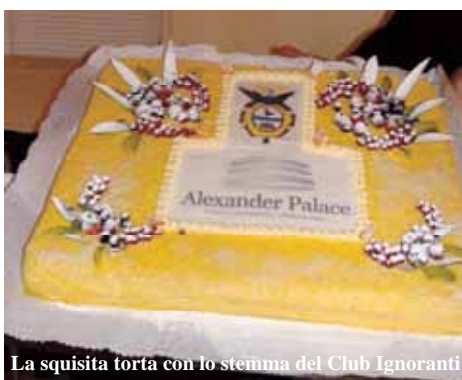
La squisita torta con lo stemma del Club Ignoranti