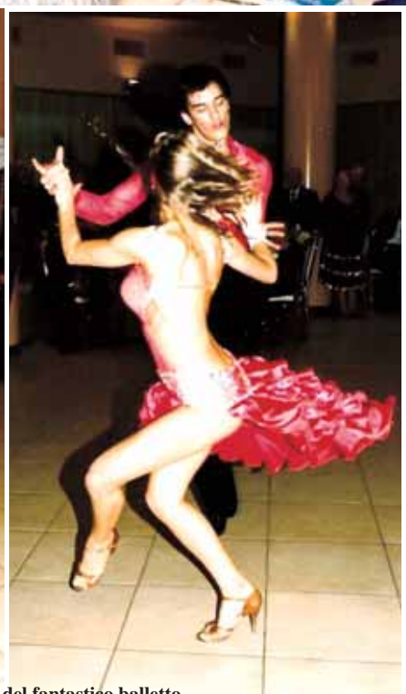
Due momenti del fantastico balletto