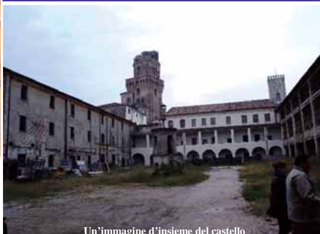
Un'immagine d'insieme del castello