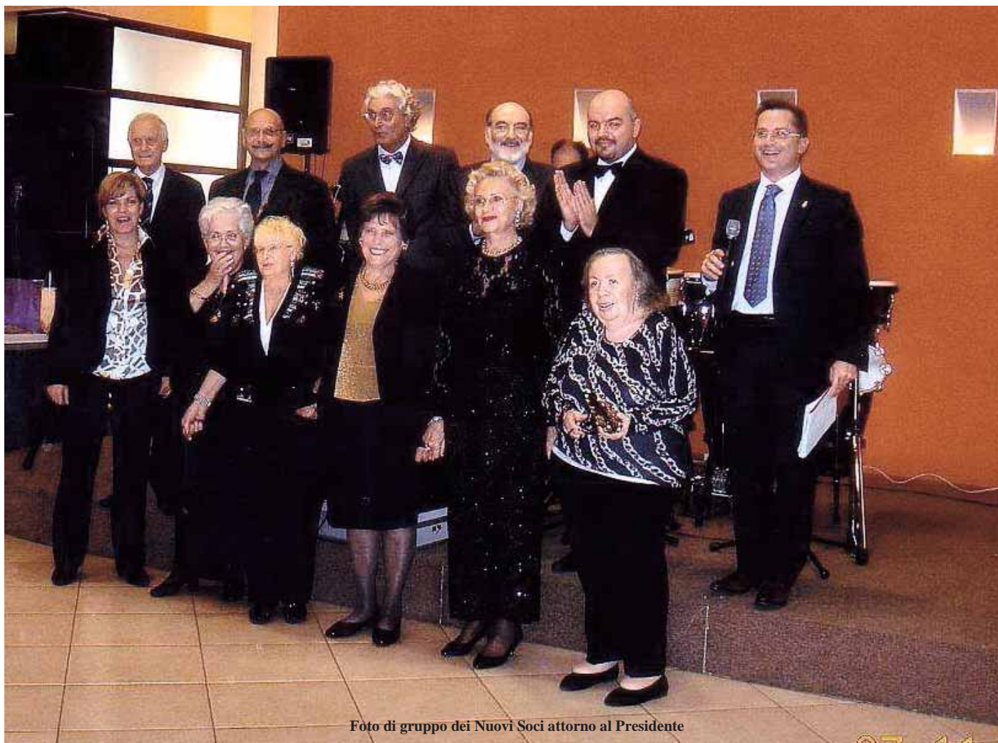
Foto di gruppo dei Nuovi Soci attorno al Presidente

Ogni anno il Club Ignoranti dedica una serata ai Nuovi Soci , e così è avvenuto domenica 7 novembre al Ristorante La Bulesca. Festa dei Nuovi Soci, dunque, in realtà....., dal mio punto di vista, anche e soprattutto Festa dei Vecchi Soci. Festa perché è l'occasione del re-incontro con gli amici. Rivedersi è gioia, è ritrovare facce conosciute, è scambiarsi abbracci, strette di mano, confidenze, pareri, chiedere e dare consigli. In una parola non sentirsi più soli, ma membri di una grande famiglia. A parte la gioia di trovarsi, domenica sera, nell'animo di tutti, c'era un velo di tristezza, di malinconia, di dolore. Gli ultimi disastrosi eventi non potevano essere dimenticati. Sulla faccia di tutti un sorriso e un'allegria un po' forzati. Cosa pensano il Presidente e tutti i membri del Direttivo è chiaro. In questa occasione non ci sono state elargizioni, perché il ricavo della serata verrà dato alle famiglie padovane che sono state alluvionate. Questo per quanto riguarda la "Charitas". Per quanto riguarda la "Laetitia"... gli antipasti, la cena, la mu-