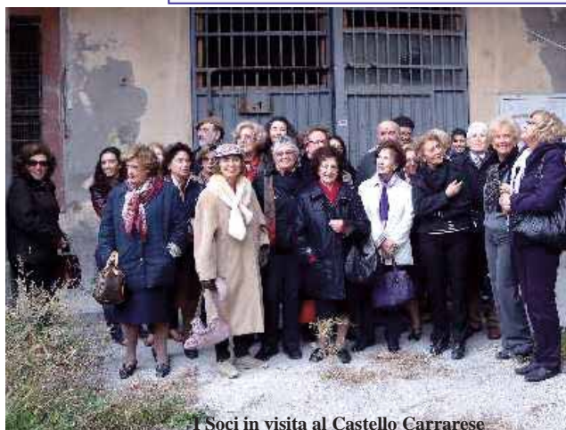
I soci in visita al Castello Carrarese