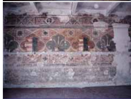
Due affreschi del castello, e nel primo l'emblema dei Carraresi (il carro)