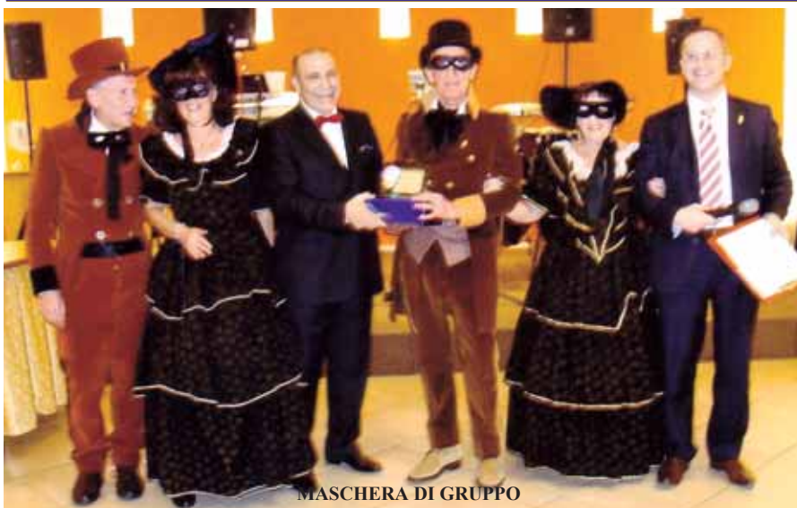
MASCHERA DI GRUPPO