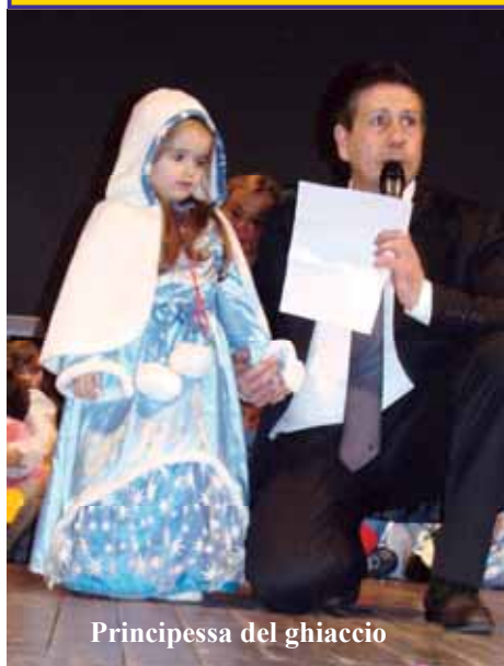
Principessa del ghiaccio