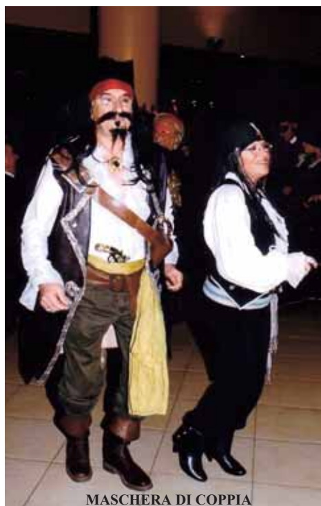
MASCHERA DI COPPIA