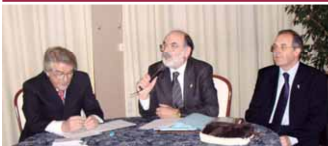
Il tavolo della Presidenza e un'immagine dell'assemblea