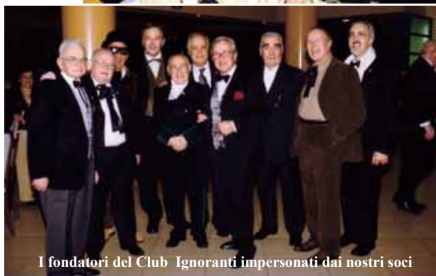
I fondatori del Club Ignoranti impersonati dai nostri soci