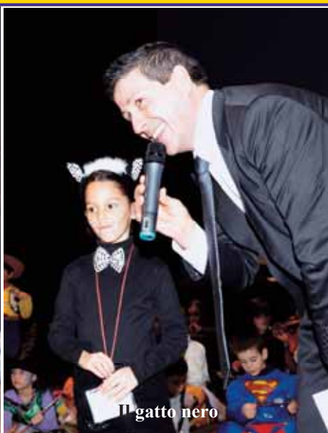
Il gatto nero