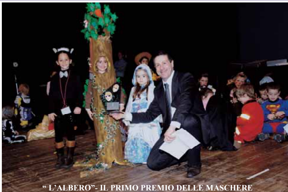
“ L’ALBERO”- IL PRIMO PREMIO DELLE MASCHERE